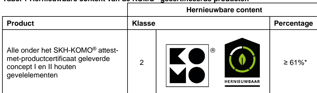
Tabel 1 Hernieuwbare content van de KOMO ® gecertificeerde producten

* gebaseerd op kozijnen en ramen vervaardigd met uitsluitend houten dorpels en stijlen, exclusief vakvulling.