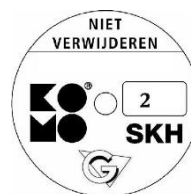
geschikt voor weerstandsklasse 2